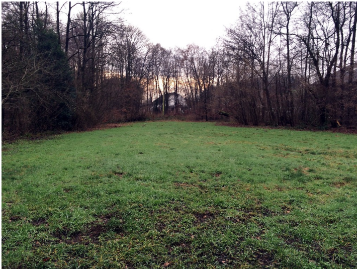
Die Fischwiese der ehemaligen Eisenhütte Abentheuer (2015).