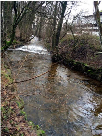
Der Traunbach bei Abentheuer (2015).