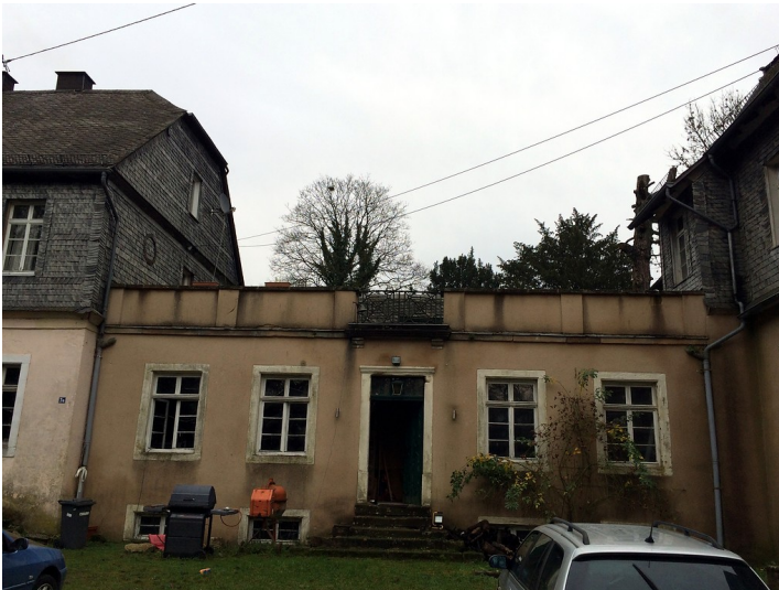
Zwischenhaus des Herren- und Gästehauses der Eisenhütte in Abentheuer (2015)