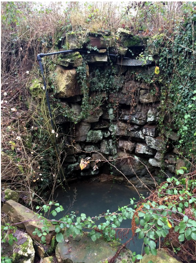
Künstlich angelegter Wasserfall im Garten des Herrenhauses der Eisenhütte in Abentheuer (2015)