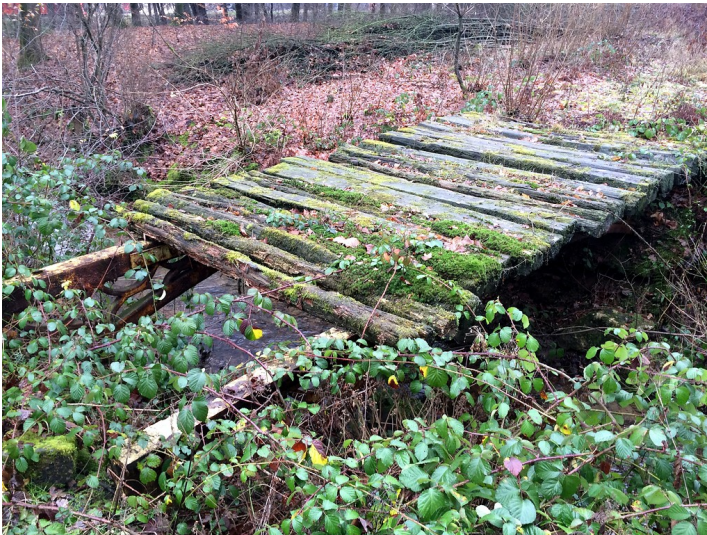
Gusseisenbrücke auf dem Gelände der ehemaligen Eisenhütte in Abentheuer (2015)