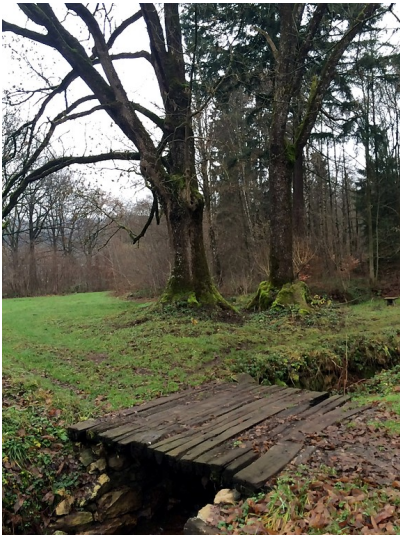
Ehemalige Zuwegung zur Abentheuerer Hütte mit einer Holzbrücke über einen Kanal des Wassersystems der Hütte (2015).