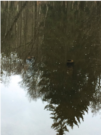
Ablauf des großen Weiher der ehemaligen Eisenhütte in Abentheuer (2015)