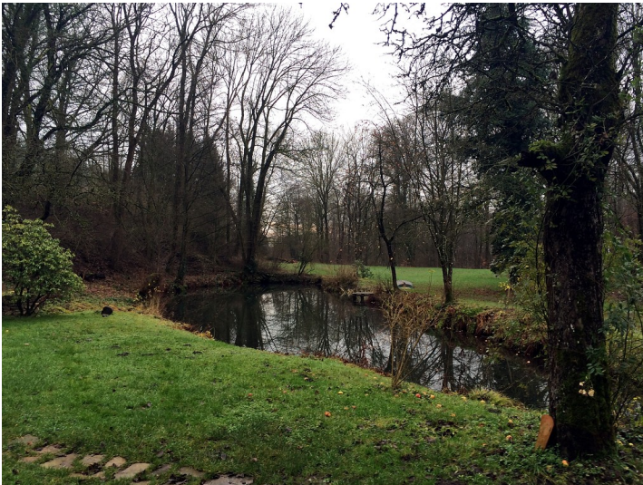
Kleiner Weiher auf dem Gelände der ehemaligen Eisenhütte Abentheuer (2015)