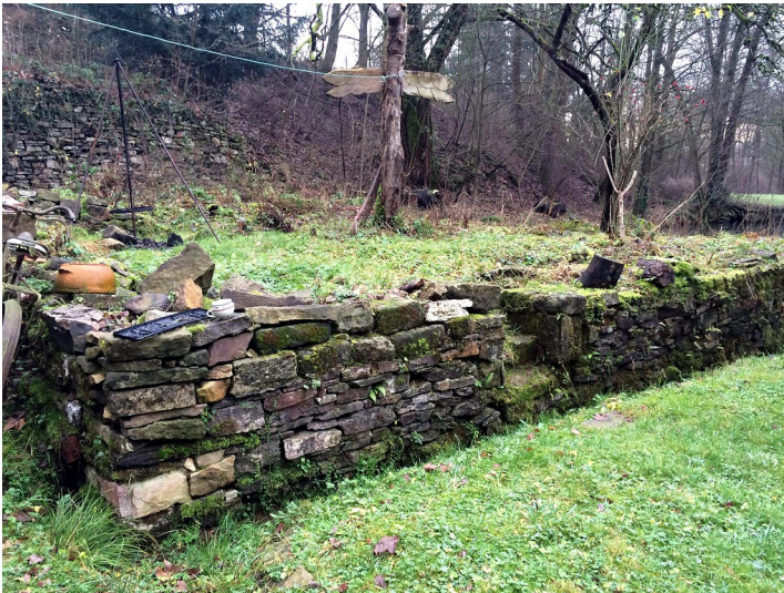
Ruine der Schmiede der Eisenhütte Abentheuer (2015)