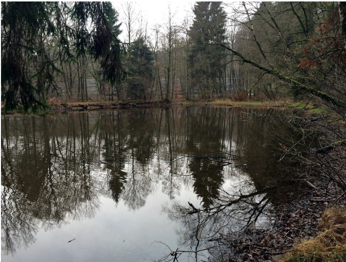
Großer Weiher auf dem Gelände der ehemaligen Eisenhütte in Abentheuer (2015)