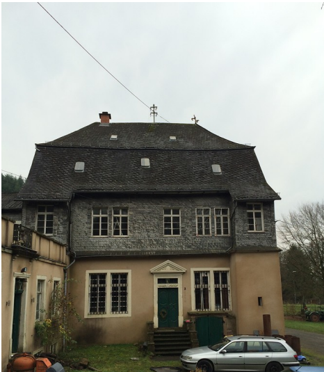
Das Herrenhaus der ehemaligen Eisenhütte in Abentheuer (2015).