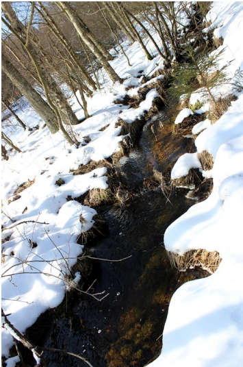
Riedfloß im Naturschutzgebiet Riedbruch bei Thranenweier (2016)