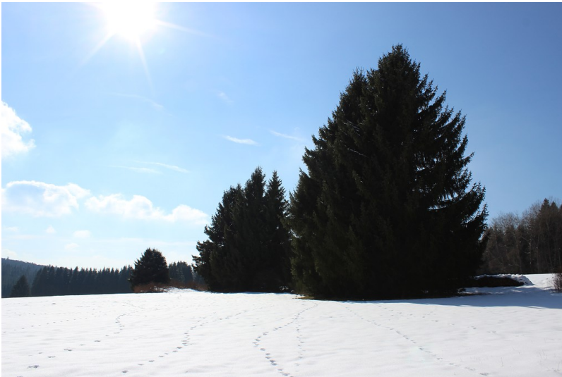
Bäume der Fichtenreihe an dem historischen Weg bei Thranenweiler (2016).