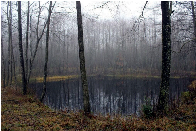
Einer der beiden Weiher bei Thranenweiler im Herbst 2015