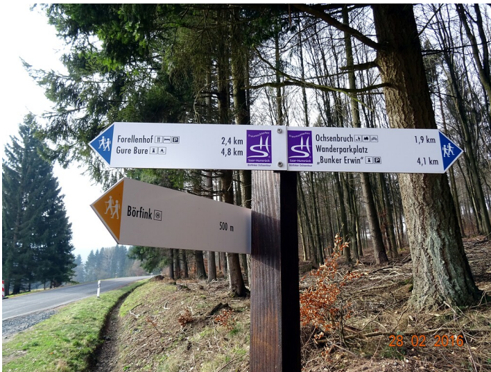
Wanderwegbeschilderung der Nationalpark-Traumschleife Börfinker Ochsentour und des Saar-Hunsrück Steig (2016)