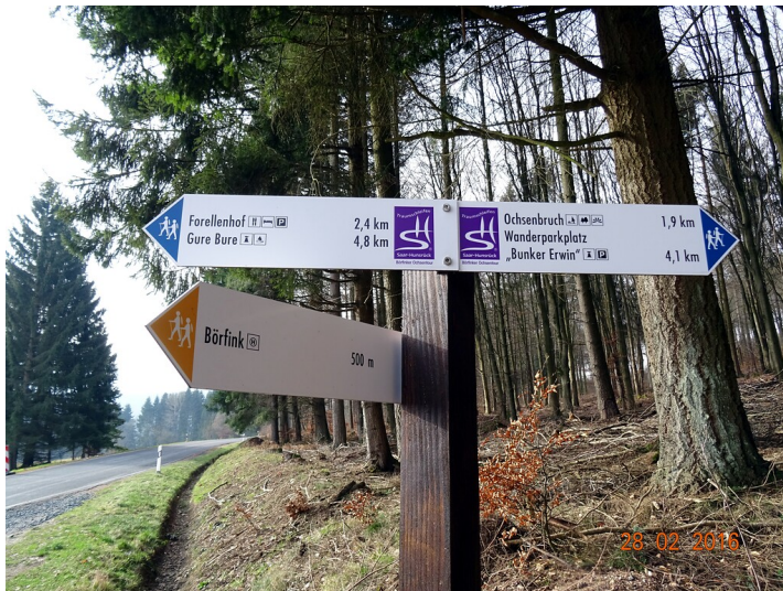
Wanderwegbeschilderung der Nationalpark-Traumschleife Böffinker Ochsentour und des Saar-Hunsrück Steig (2016)