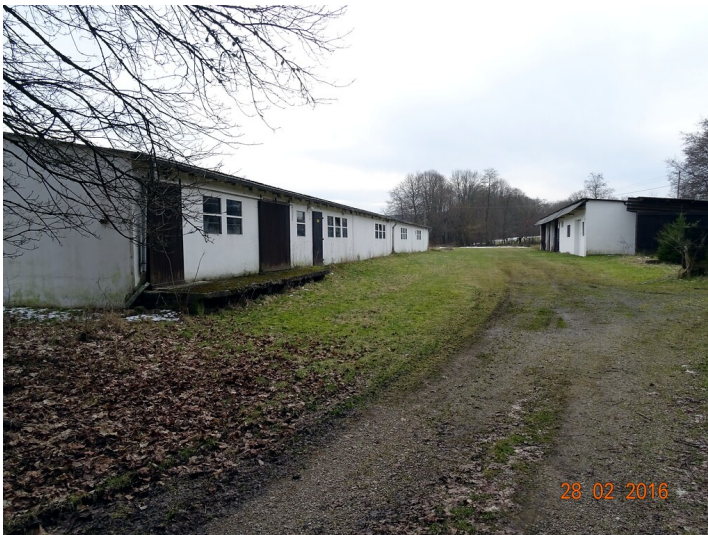
Stallungen und Wirtschaftsgebäude bei Börfink (2016)