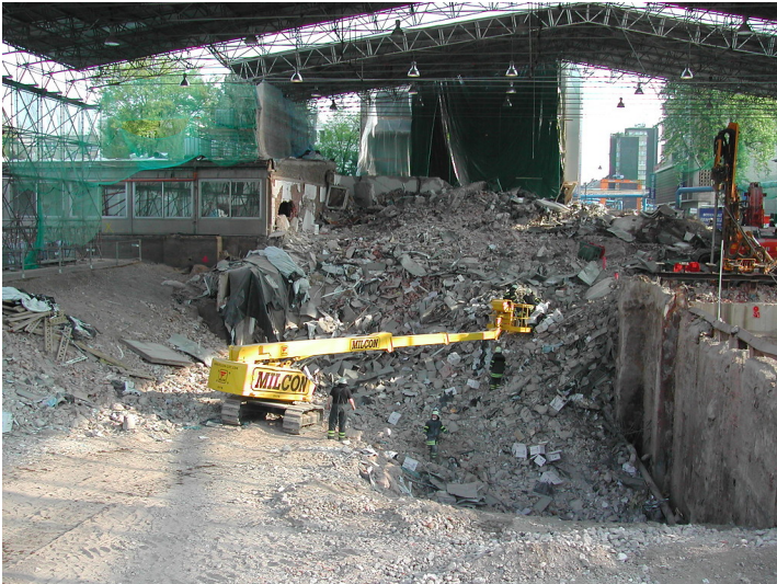
Aufräum- und Bergungsarbeiten an dem am 3. März 2009 eingestürzten Historischen Archiv der Stadt Köln (April 2009).