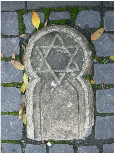
Synagoge Hamm (Sieg): Ein jetzt in den Synagogenplatz eingelassenes Relikt des 1938 verwüsteten und in Brand gesteckten jüdischen Gotteshauses (2009).