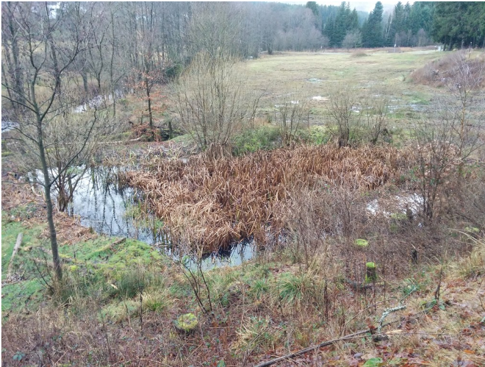
Tümpel an der alten Mühle bei Börfink (2015).