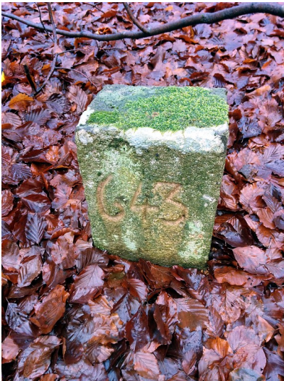
Grenzstein 643 zwischen Allenbach und Rinzenberg. Die Zahl 643 ist deutlich zu erkennen (2015).