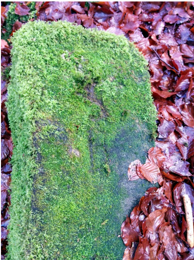
Grenzstein 642 zwischen Allenbach und Rinzenberg