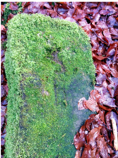
Grenzstein 642 zwischen Allenbach und Rinzenberg