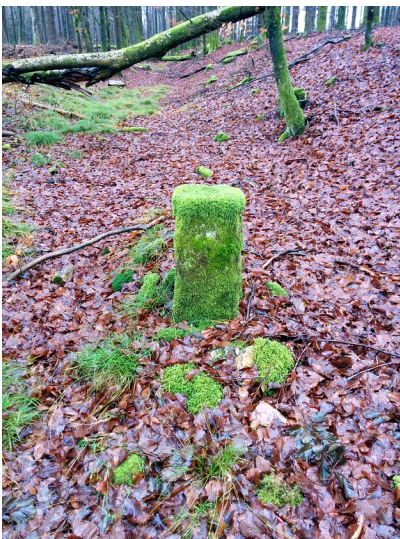
Grenzstein 641 zwischen Allenbach und Rinzenberg (2015).