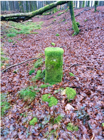
Grenzstein 641 zwischen Allenbach und Rinzenberg (2015).