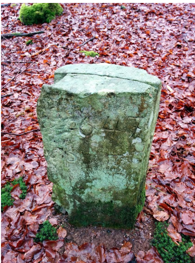
Frontansicht des Grenzsteins 647 bei Börfink (2015)