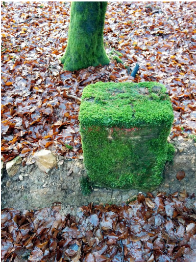
Frontansicht des Grenzsteins 644 bei Börfink (2015)