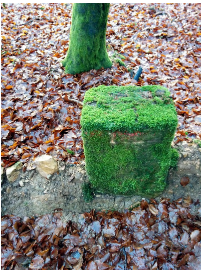
Frontansicht des Grenzsteins 644 bei Börfink (2015)