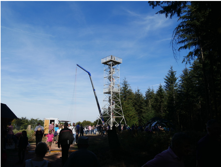
Aussichtsturm auf dem Hochsteinchen im Soonwald bei Rheinböllen (September 2018)