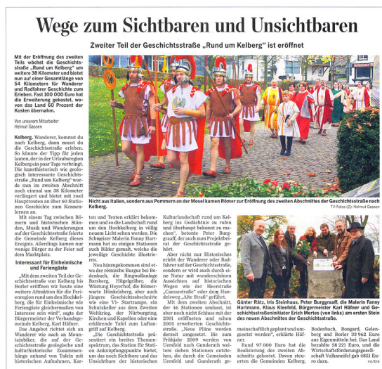
Artikel der "Dauner Zeitung" zur Eröffnung des zweiten Abschnitts der Geschichtsstraße "Rund um Kelberg" (13.11.2008).