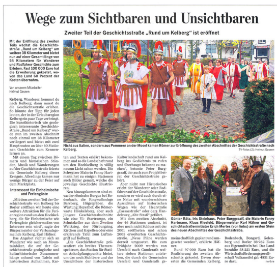
Artikel der "Dauner Zeitung" zur Eröffnung des zweiten Abschnitts der Geschichtsstraße "Rund um Kelberg" (13.11.2008).