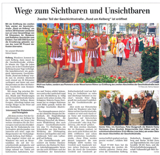
Artikel der "Dauner Zeitung" zur Eröffnung des zweiten Abschnitts der Geschichtsstraße "Rund um Kelberg" (13.11.2008).