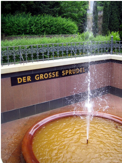
Großer Sprudel im Kurpark Bad Neuenahr (2016).