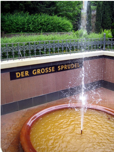
Großer Sprudel im Kurpark Bad Neuenahr (2016).