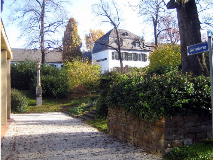
Willibrordus-Säule in Bad Neuenahr (2015).