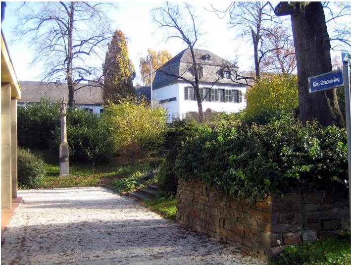
Willibrordus-Säule in Bad Neuenahr (2015).