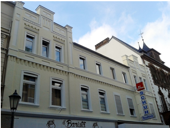
Ehemaliges Kaiserliches Postamt Bad Neuenahr (2016)