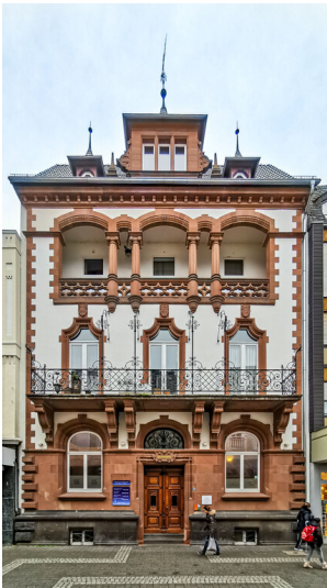
Dr. Niessen-Haus in Bad Neuenahr (2020)