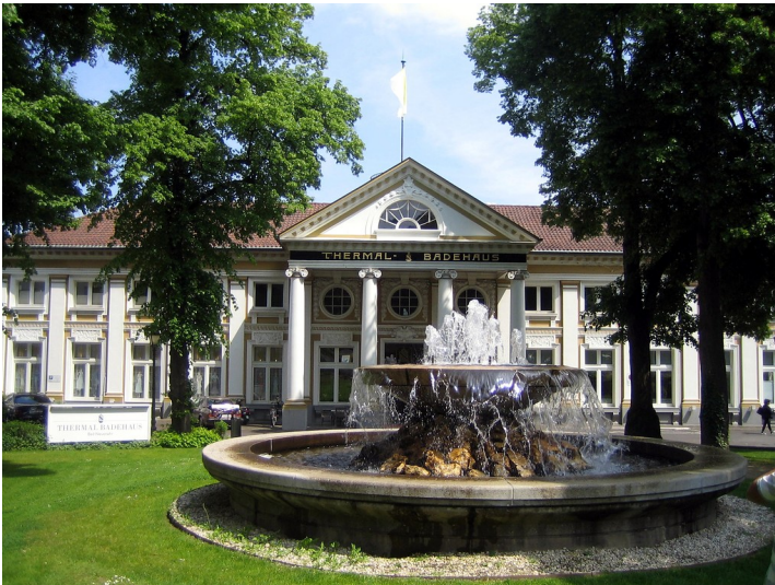
Thermalbadehaus in Bad Neuenahr (2016)