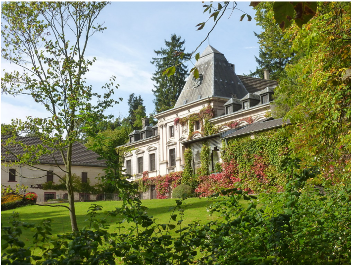
Das Schloss mit Park am Kirchberg im Ortskern Kommern (2014).