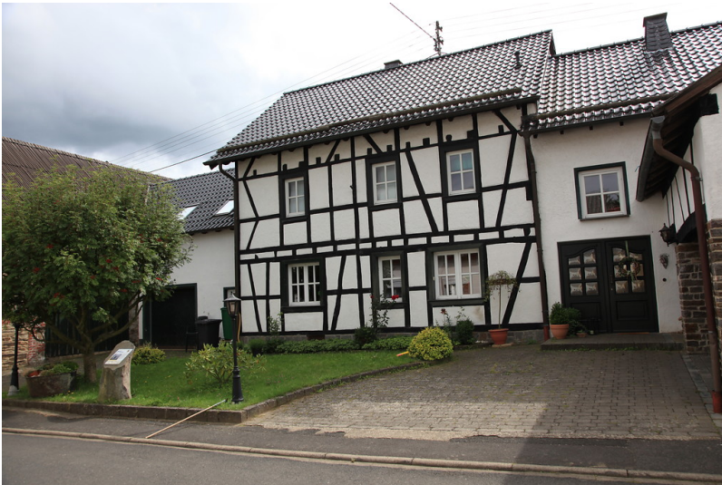
Das Fachwerkwohnhaus der Pottaschehersteller Lorenz Heintz in Bodenbach (2011).