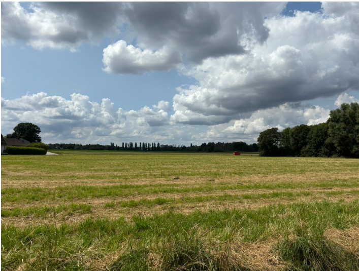
Äußerer Grüngürtel am Rather Kirchweg (2024)