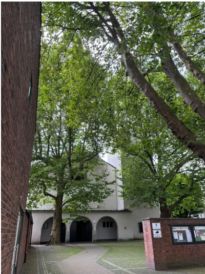
Katholische Pfarrkirche Sankt Hubertus in Brück (2024)