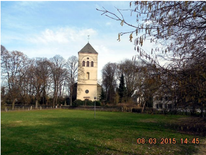
Katholische Pfarrkirche St. Gereon in Merheim (2015), der Kirchturm von Westen aus gesehen.