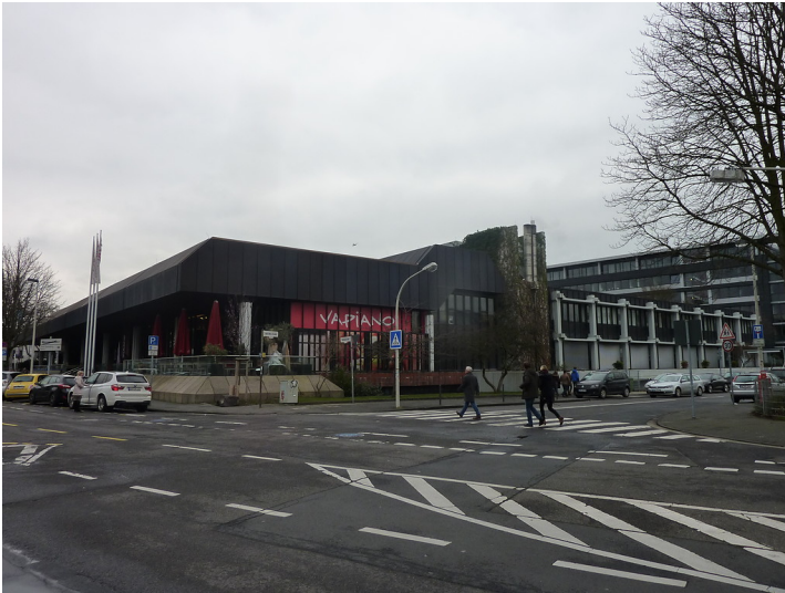
Die ehemalige SPD-Parteizentrale in Bonn, das Erich-Ollenhauer-Haus in der Ollenhauerstraße (2015).