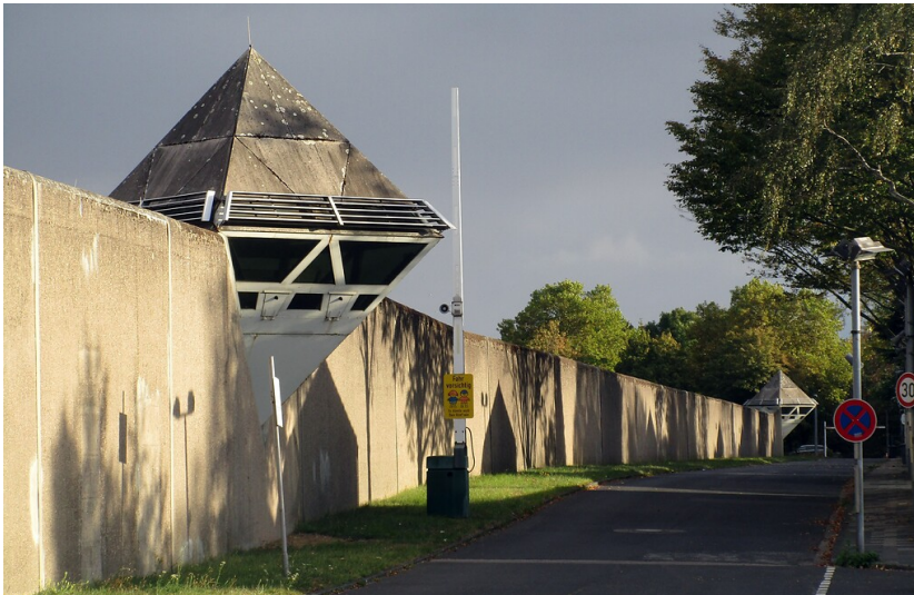
Gefängnismauer mit würfelförmigem Wachturm der Justizvollzugsanstalt Köln-Ossendorf (2020).