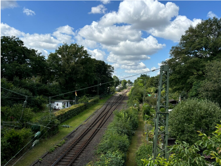
Eisenbahnstrecke Köln-Mülheim - Bergisch Gladbach (2024)