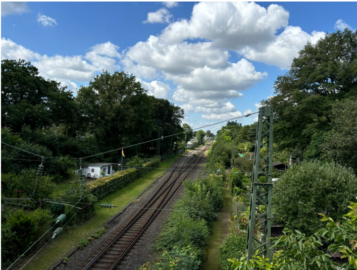
Eisenbahnstrecke Köln-Mülheim - Bergisch Gladbach (2024)