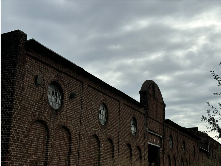
Fabrikgelände des Unternehmens CordierSpezialpapier GmbH auf dem ehemaligen Gelände der Schweinheimer Mühle (2024)