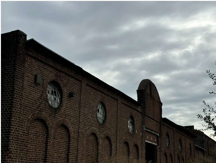
Fabrikgelände des Unternehmens CordierSpezialpapier GmbH auf dem ehemaligen Gelände der Schweinheimer Mühle (2024)