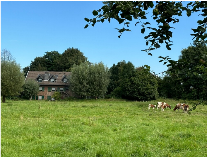
Iddelsfelder Mühle in Dellbrück (2024)