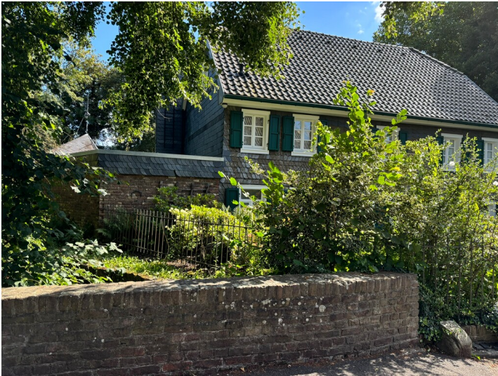
Im Bergischen Stil erbautes Hauptgebäude der Strunder Mühle in Dellbrück (2024)