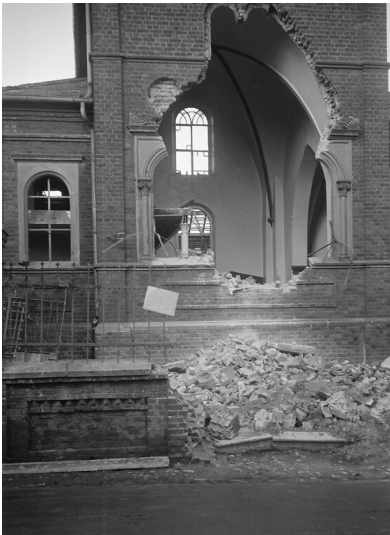
Die Ruine der 1883 erbauten Synagoge Mechernich. Das Gotteshaus wurde im Zuge des Novemberpogroms 1938 geschändet und schwer beschädigt, 1939 abgerissen. Die Aufnahme entstand vermutlich kurz nach der Zerstörung durch einen erschütterten Zeitzeugen.