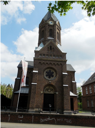
St. Cornelius Pfarrkirche in Köln-Heumar mit Blick auf den Haupteingang und den Turm (2015)