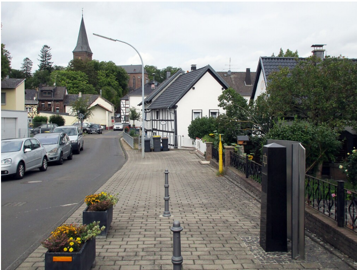
Der Gedenkstein am früheren Standort der 1938 niedergebrannten Synagoge Kommern in der Pützgasse (2020).