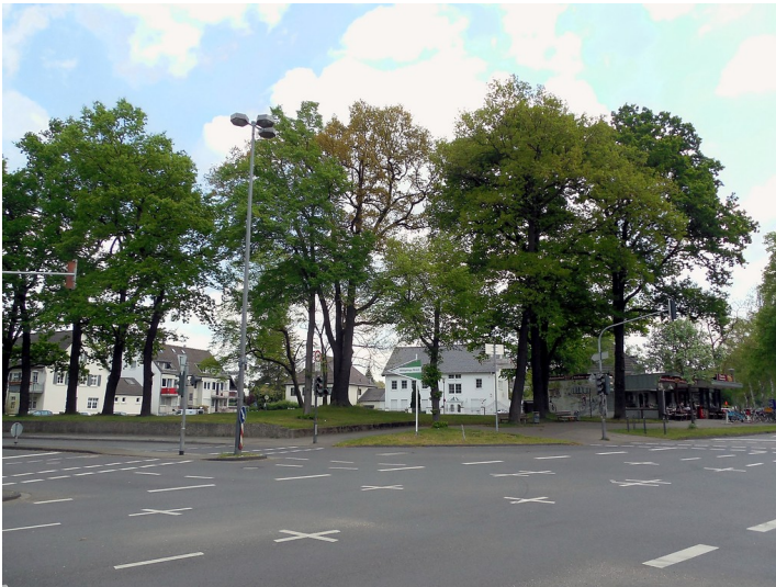
Das Ortszentrum von Rath an der Rösrather Straße (2015)