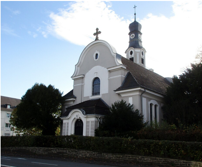
Blick auf die evangelische Christuskirche an der Bergisch Gladbacher Straße in Köln-Dellbrück (2022).