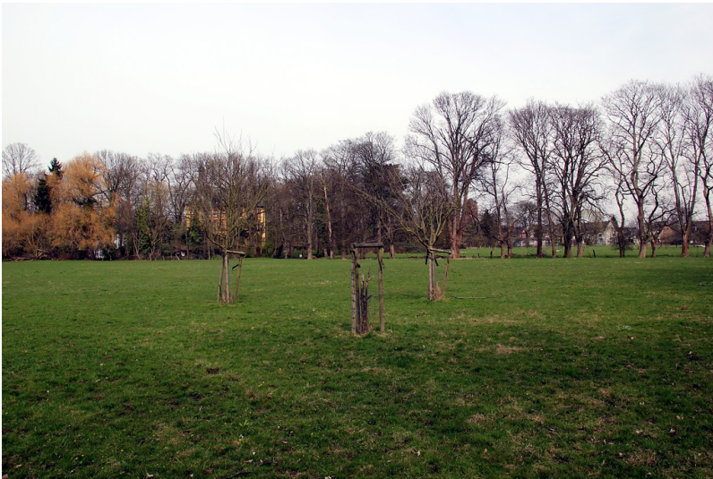
Freifläche vor Haus Isenburg in Köln-Holweide (2015)